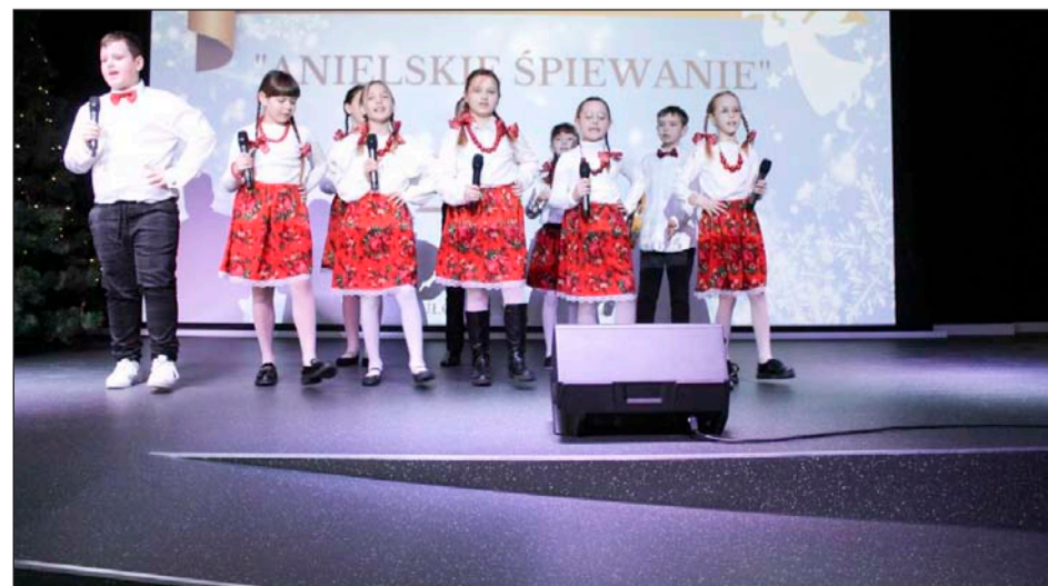
» Konkurs „Anielskie Śpiewanie” z roku na rok cieszy się coraz większym zainteresowaniem, stanowiąc piękną okazję do podtrzymywania tradycji i wspólnego muzykowania