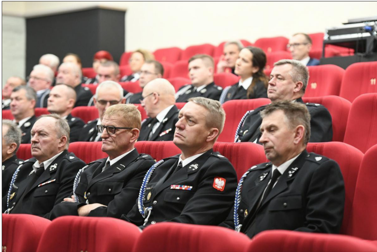
W 2024 roku strażacy ochotnicy z powiatu łukowskiego uczestniczyli w około 1200 zdarzeniach, w tym w pożarach, wypadkach oraz innych działaniach ratowniczych.