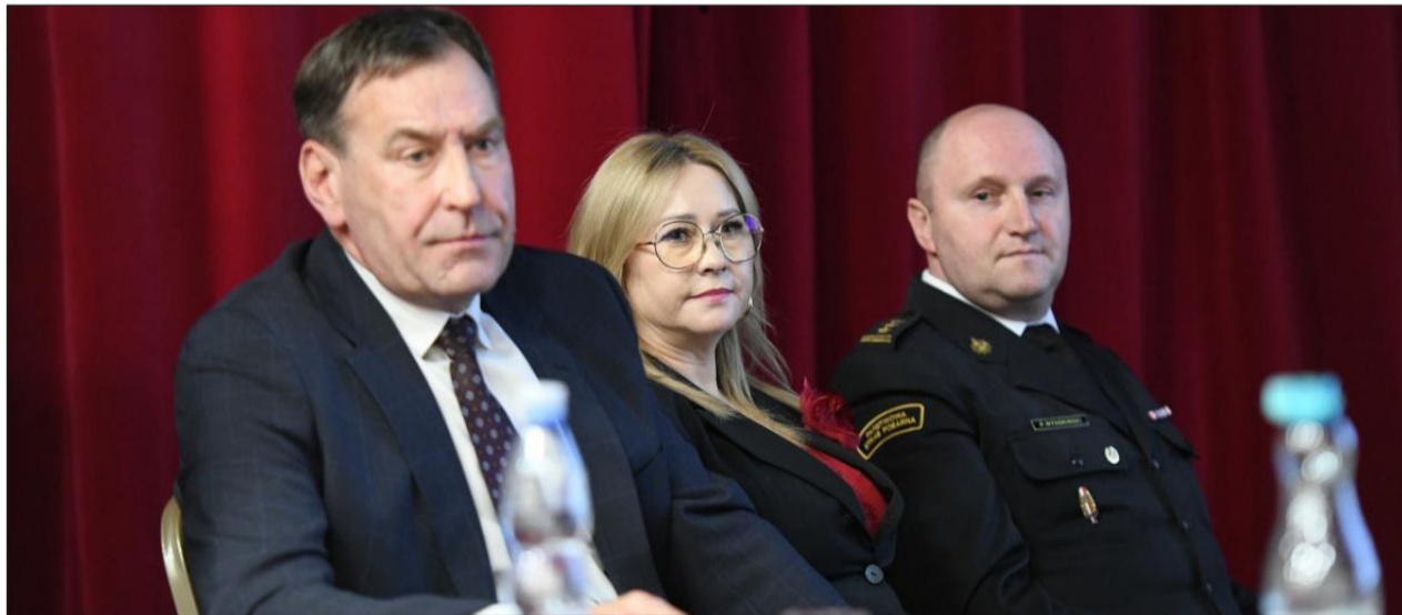
W Gminnej Bibliotece Publicznej w Starych Kobiątkach odbyło się wyjątkowe posiedzenie Zarządu Oddziału Powiatowego Związku Ochotniczych Straży Pożarnych RP w Łukowie