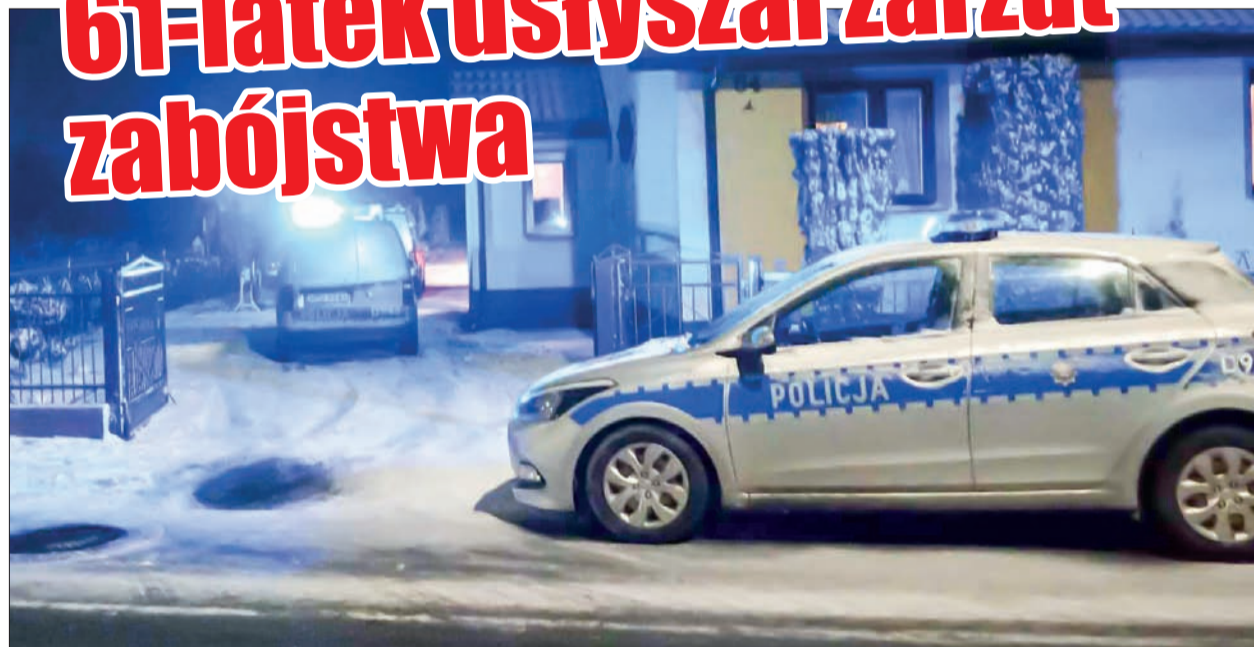
Nieoficjalnie wiadomo, że podejrzany mógł być pod wpływem alkoholu, jednak ostateczne wyniki badań krwi będą dostępne po analizie laboratoryjnej.