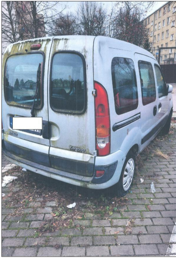
❖ Samochód jest nieużytkowany od kilku lat, ma urwane lustro, zbite tylne światło, przebitą oponę, a na licznych elementach karoserii porośnięty jest mchem.