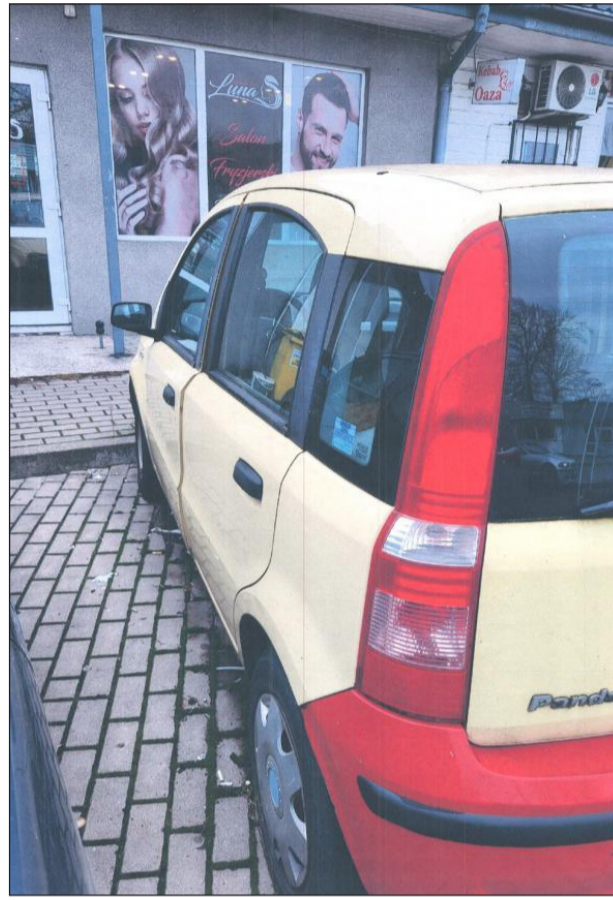
❖ Dzięki staraniom Przewodniczącego Rady Miasta z ulic Łukowa znikają wraki

podobnie nie posiada aktualnego ubezpieczenia OC.”. Zaniedbany pojazd nie tylko szpeci okolice, ale przede wszystkim zajmuje miejsce parkingowe, które mogłoby służyć mieszkańcom.