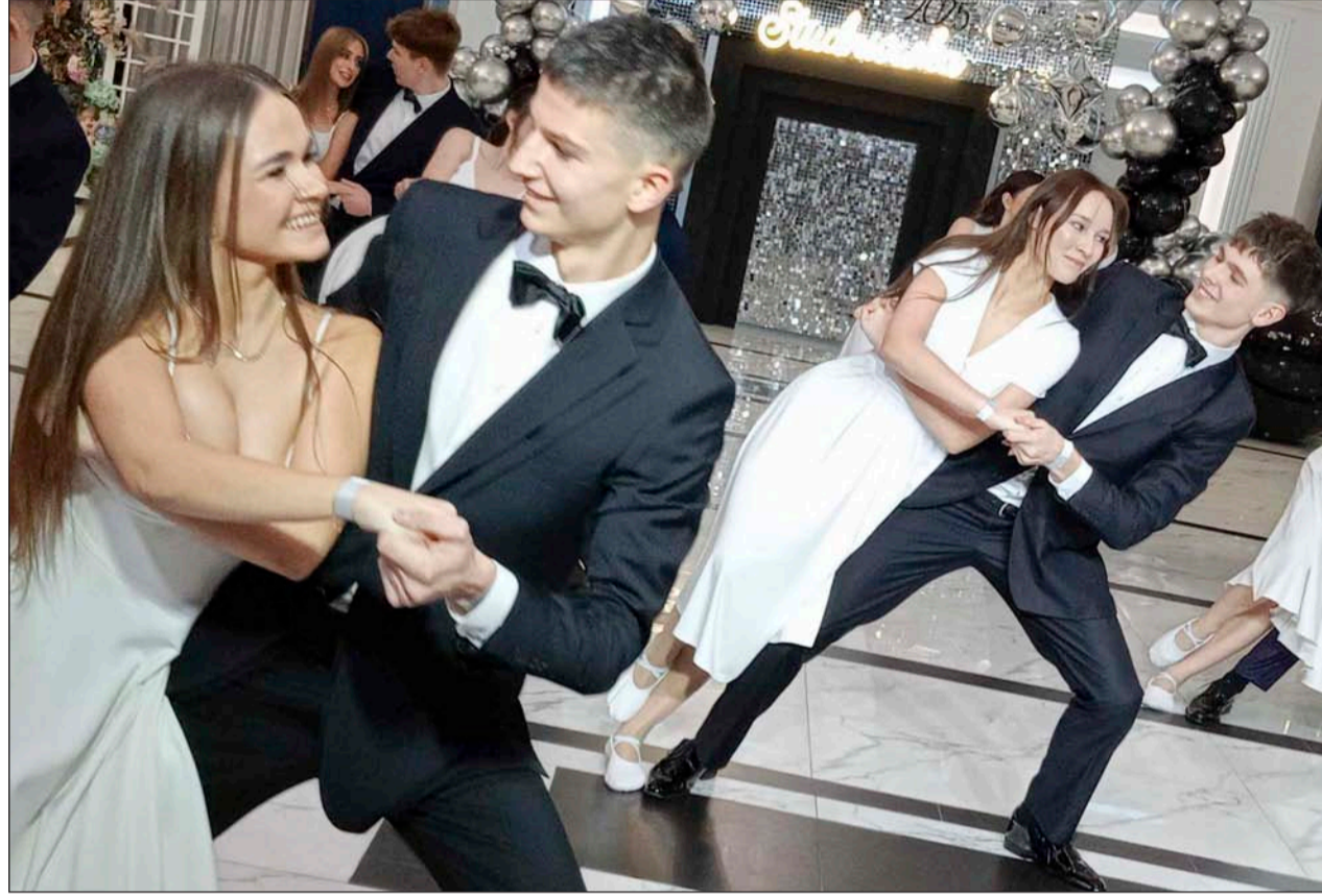
» Studniówka to nie tylko tradycyjny polonez – uczniowie I LO w Łukowie postanowili dodać swojemu balowi wyjątkowego charakteru, przygotowując efektowny układ taneczny do walca

Walc okazał się nie tylko pięknym widowiskiem, ale także chwilą wzruszenia, podkreślającą wagę studniówki jako symbolicznego odliczania do matury. To moment, który na długo zostanie w pamięci uczestników i gości. Dla wielu uczniów był to pierwszy tak oficjalny występ taneczny, a emocje widoczne na ich twarzach świadczyły o dumie i radości.