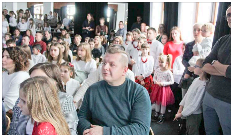
» Publiczność nie mogła wyjść z zachwytu