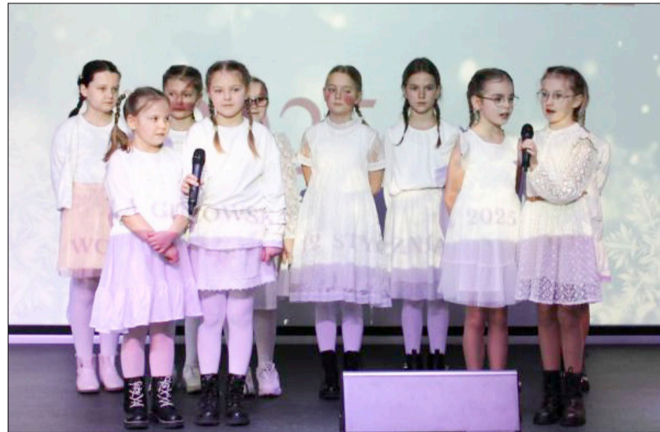
» Konkurs odbył się w Domu Kultury-Pomniku Czynu Bojowego Kleeberczyków w Woli Gułowskiej, miejscu o szczególnym znaczeniu dla lokalnej społeczności

wyróżnieniem. Podczas tegorocznej edycji wyłoniono laureatów w kilku kategoriach, a ich występy zachwyciły zarówno jury, jak i zgromadzoną publiczność. Organizatorzy podkreślali wysoki poziom artystyczny wszystkich uczestników oraz ich ogromne zaangażowanie. Konkurs „Anielskie Śpiewanie” z roku na rok cieszy się coraz większym zainteresowaniem, stanowiąc piękną okazję do podtrzymywania tradycji i wspólnego muzykowania. Nie zabrakło obietnic, że za rok wydarzenie odbędzie się ponownie.